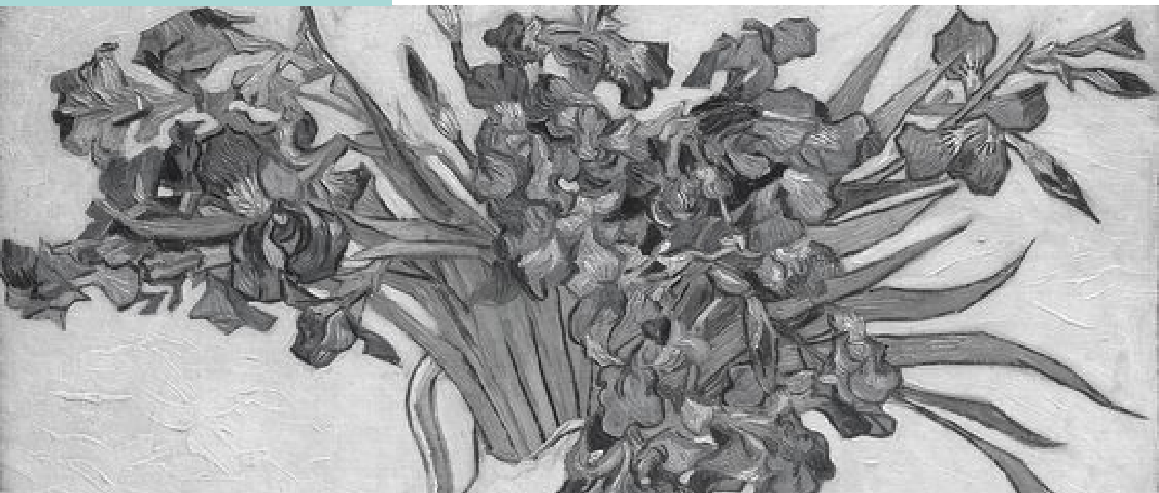
Vincent Van Gogh, Iris, the Met